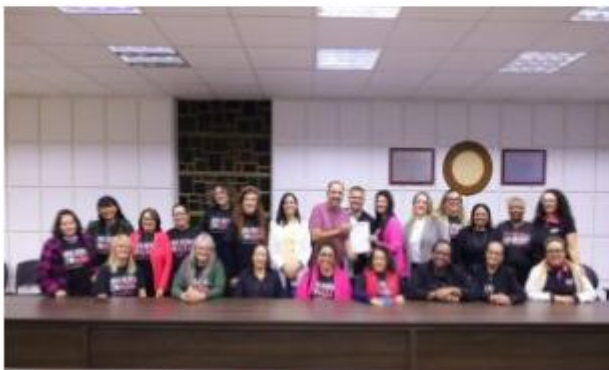
Mauá declara de utilidade pública a ONG Mulheres em Ação, que atua no acolhimento e apoio a mulheres em situação de violência